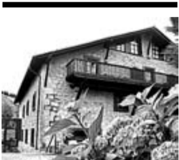
Ansotegi Nekazal Hotela, Etxebarrin.

Ansotegi, leku eroso, atsegin eta lagunartekoa