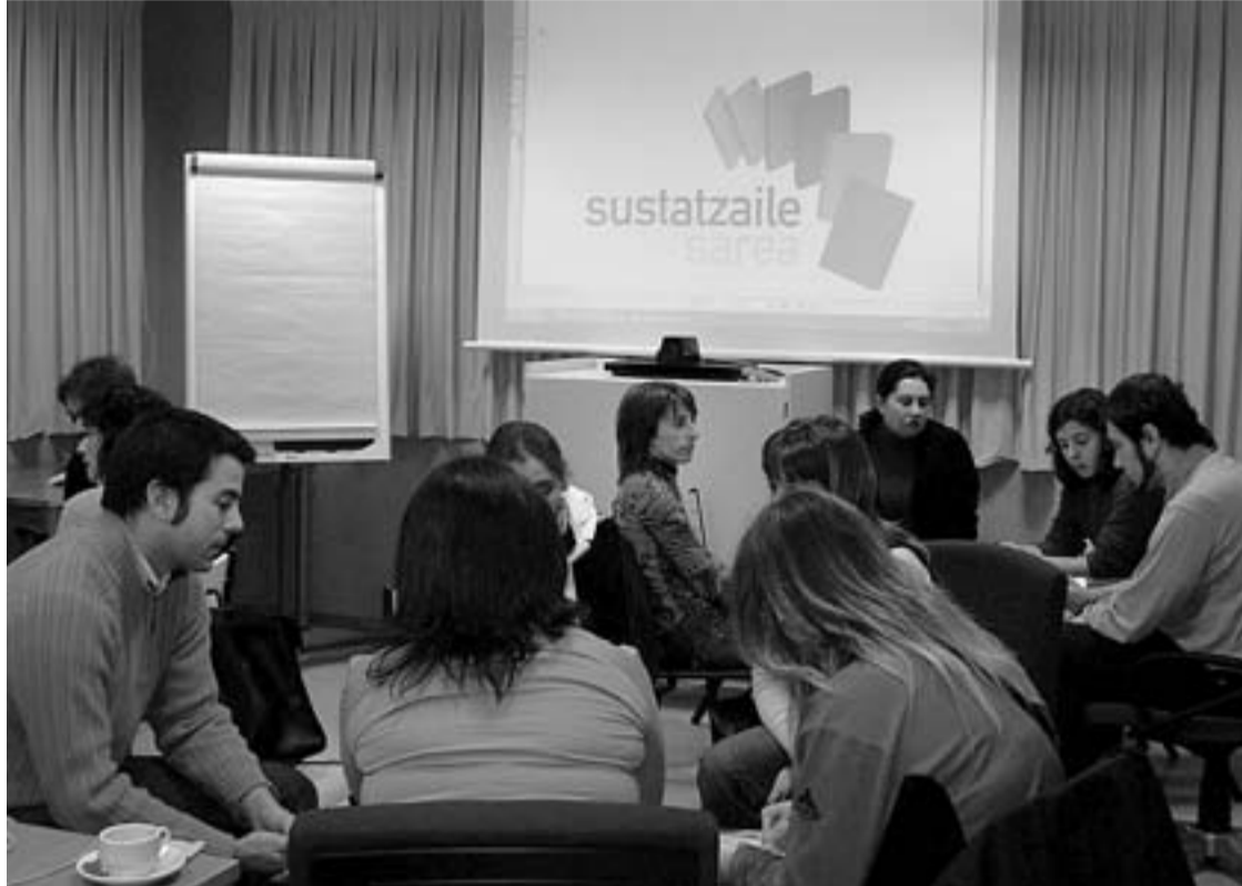
Sustatzaileen sareak bere lehenengo batzarra egin zuen Sustatzaileen Egunean; 48 enpresa dira bertako partaide gaur egun.

▶ Aitatutako foroan, eskualdeko hamalau enpresek hartu zuten parte eta eskualde mailako elkarte bat sortzeaz egin zuten berba.