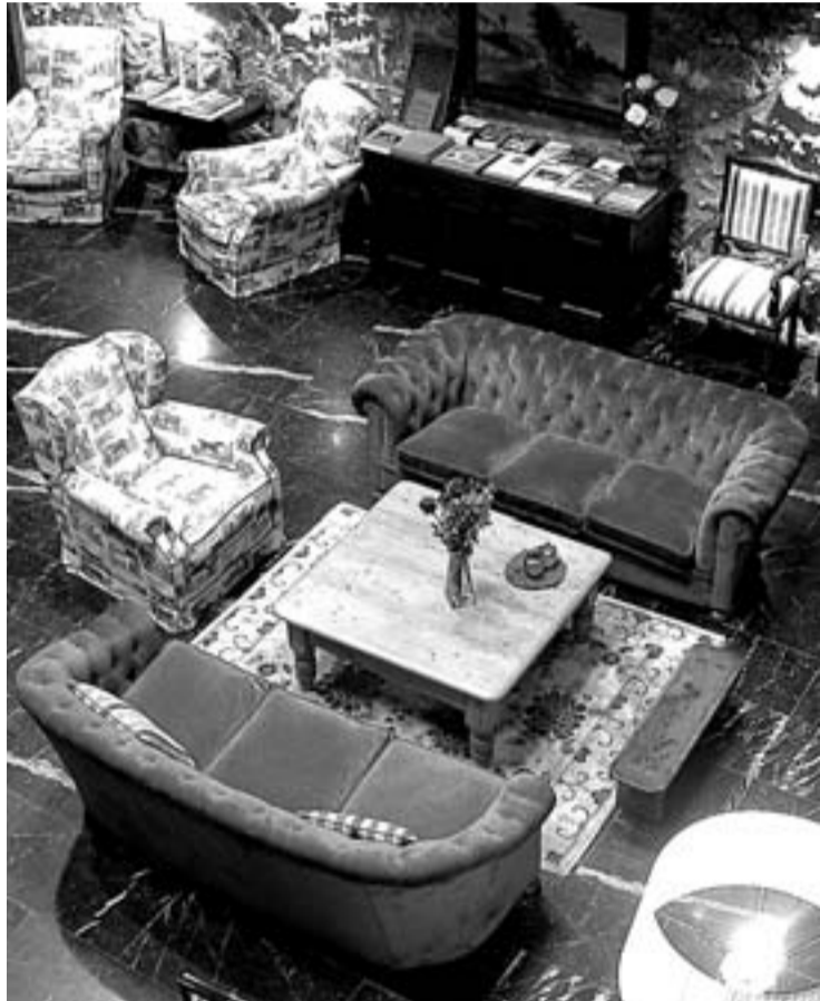
Espazio zabalek eta ondo zaindutako detaileek osatzen dute baserriaren barneko alde.

Ansotegi nekazal hotelak lasaitasunez egoteko gune eroso, atsegin eta lagunartekoa eskaintzen du