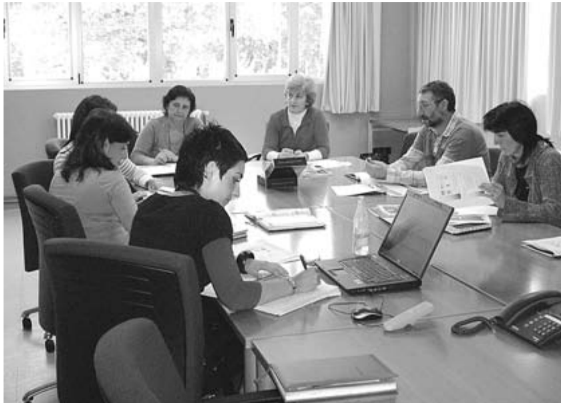
Ikastetxeen mahaiak egin dituen batzarretako baten irudian, ikastetxeetako eta Azaro Fundazioko ordezkariak.

► Eskualdean egon daitezkeen negozio aukerak detektatzeko helburuagaz, inguruko adituekin harre-