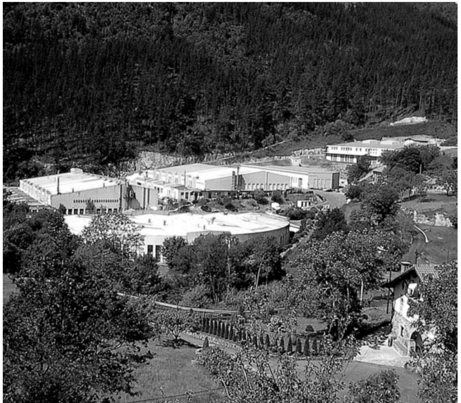
Okamika Industrialdeko zenbait enpresen artean eratu dute berrikuntza mahaia; dibertsifikatu beharraz eta kalitateaz jardun dute, besteak beste, lehen bileretan.

Sei mahai eratu ditu Azarok, hausnarketa eragiteko • IV-V