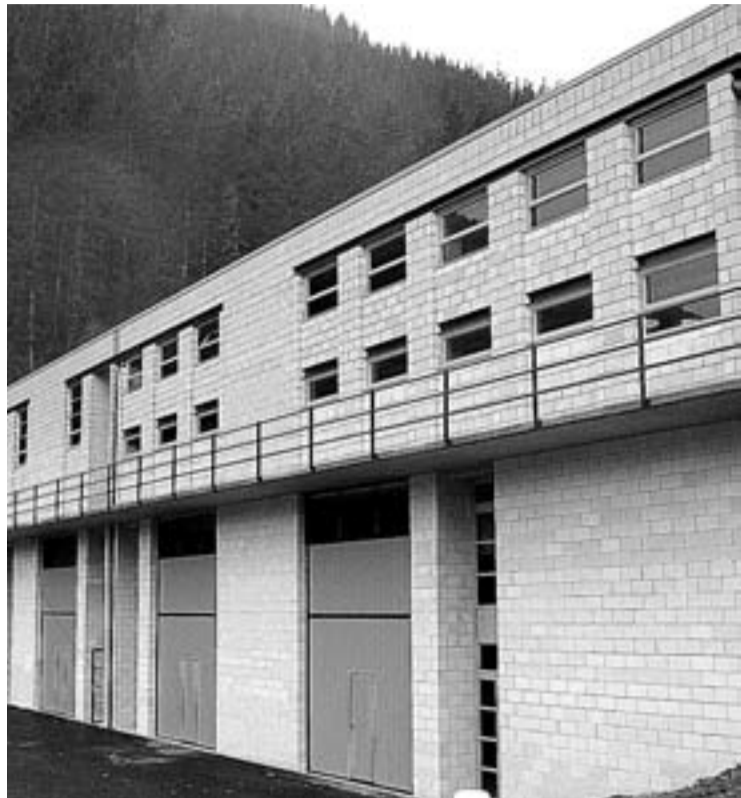
Okamika Industrialdean berrikuntza mahaia ipini dute martxan sei enpresak.