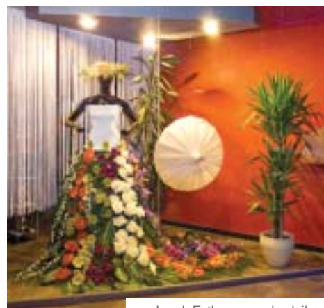
Lorak Esther-en erakusleihoa