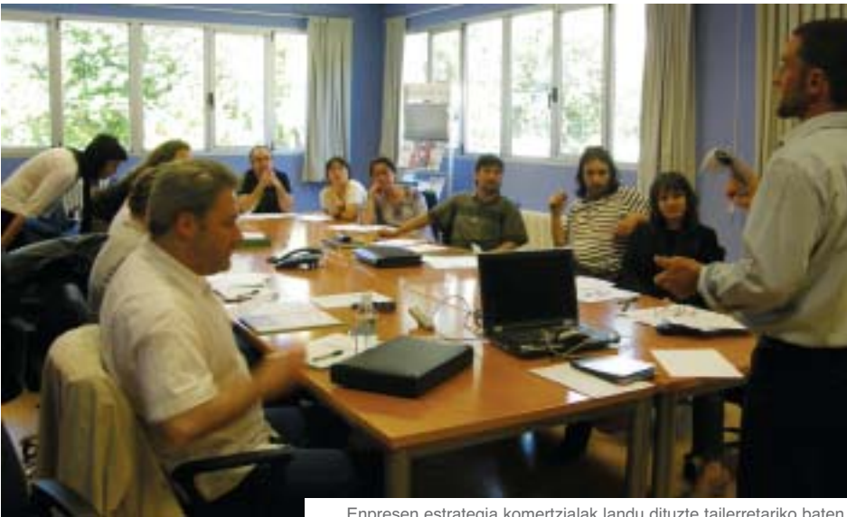
Enpresen estrategia komertzialak landu dituzte tailerretariko baten.

Ekimen zaletasuna bultzatzea eta pertsona ekintzaileen ahalegina, ekarpena eta kemena aitortzeko helburuarekin, urtero legez, EKINTZAILEAREN EGUNA ospatu dugu Lea-Artibain. Maiatzean hainbat ekitaldi egin dira enpresa sortu duten edo bide horretan ari diren ekintzaileei bideratuta. HAZIren zenbaki honetan ekintza horien berri emango dugu enpresa sortu berriei bideratuta dagoen atal honetan.