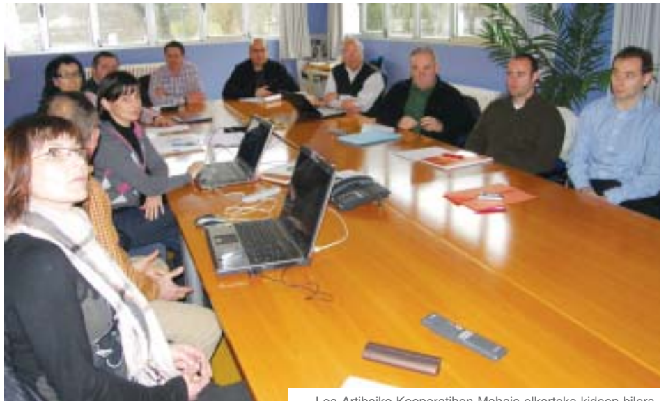
Lea-Artibaiko Kooperatiben Mahaia elkarteko kideen bilera.

Elkarteak ekintza berri bat jarri du martxan Azaro Fundazioaren laguntzarekin eta enpresa proiektuak kooperatiba eredura bideratzeko helburuarekin: «Enpresa proiektu kooperatiboen lehiaketa».